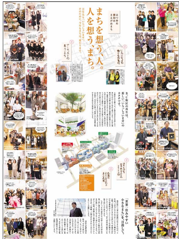
高松丸亀町商店街は、まち中の再開発事業として全国的な注目を集めています。2007年1月に当社が企画制作した新聞広告は「第27回日本新聞協会新聞広告賞」を受賞しました。